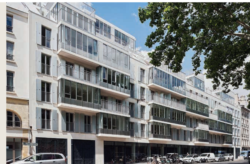
1 PARIS 5° - 25-33 CARDINAL 135 logements et 1200 m² de commerces Architecte : AGENCE ANTONINI DARMON Copromoteur : Cogedim