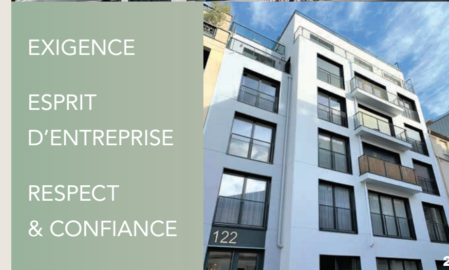
2 BOULOGNE - JAZZY 23 logements Architecte : GCG ARCHITECTES